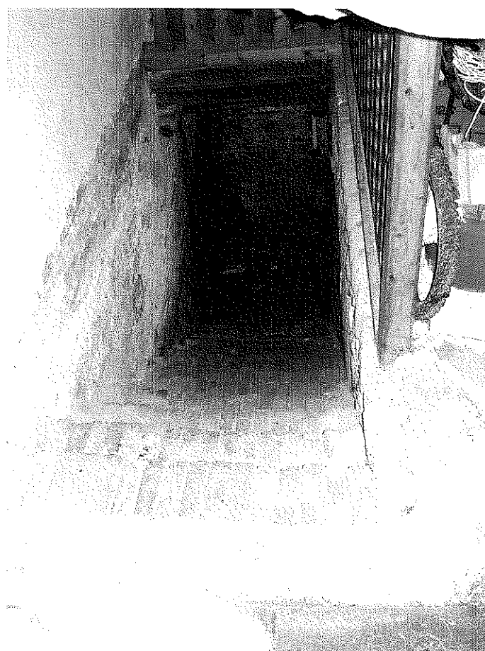
FOTOGRAFIA N. 6