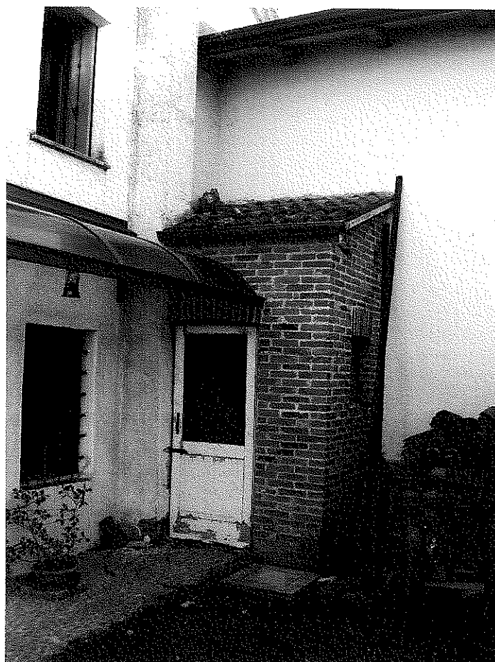
FOTOGRAFIA N. 3