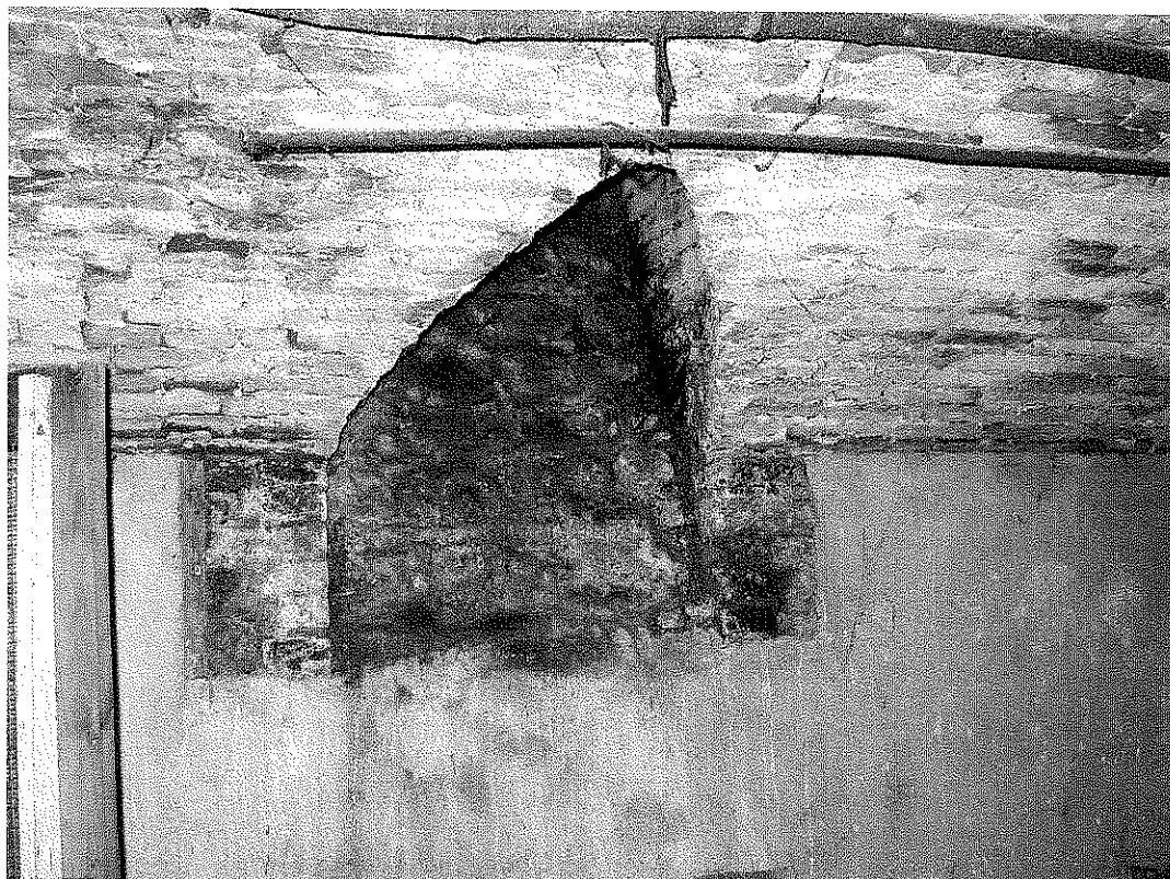
FOTOGRAFIA N. 7