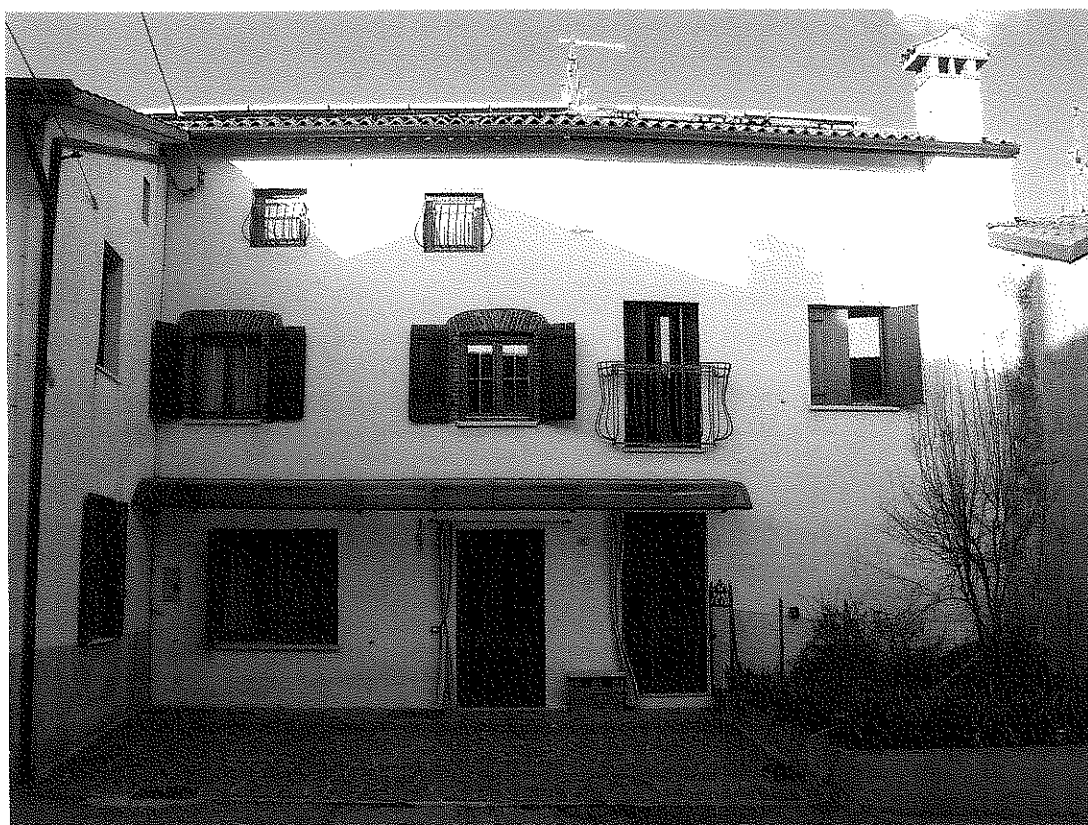
FOTOGRAFIA N.1 - prospetto Sud-Ovest