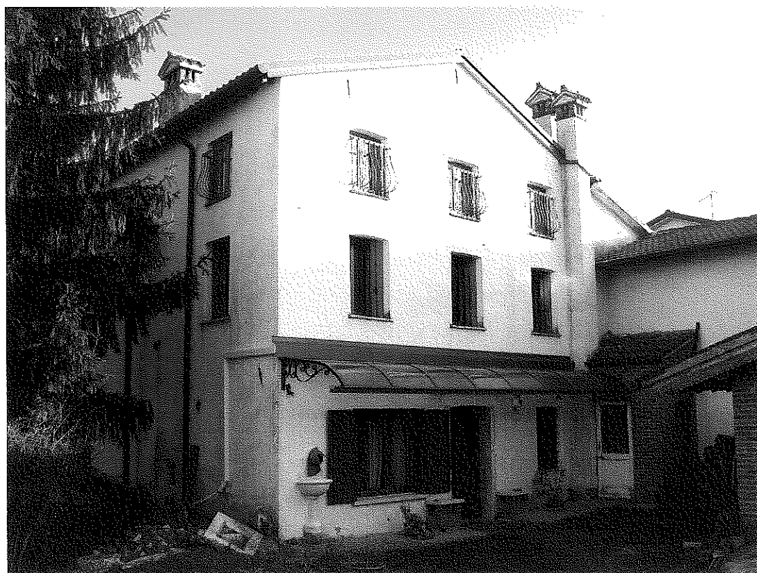
FOTOGRAFIA N. 2 - prospetto Nord-Ovest