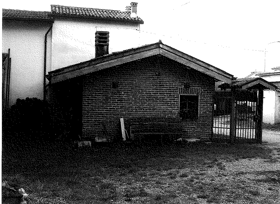
FOTOGRAFIA N. 4