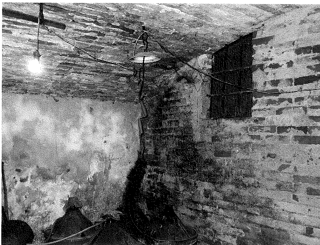
FOTOGRAFIA N. 8