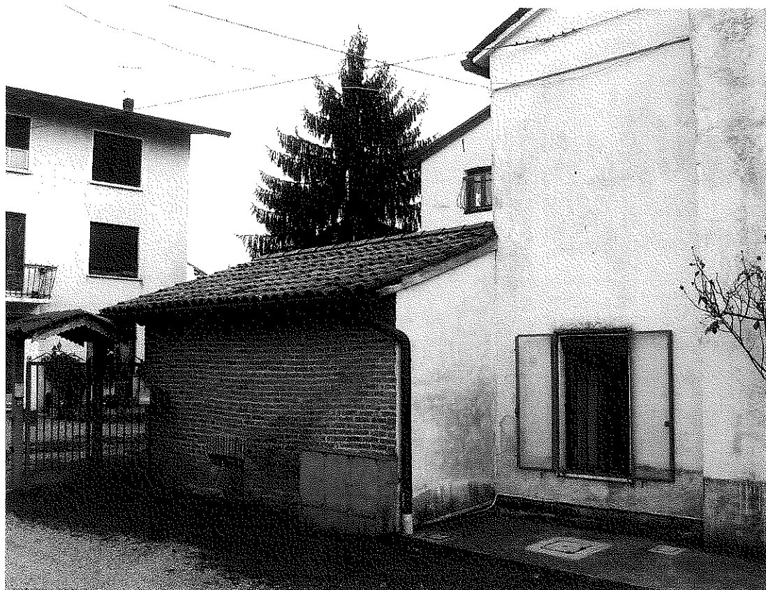
FOTOGRAFIA N. 5